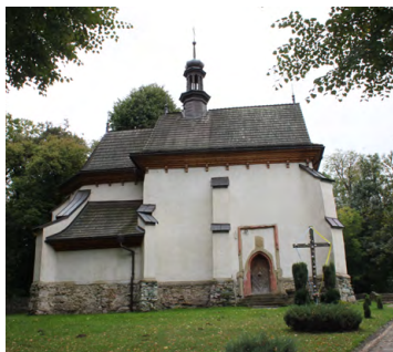
Kościół w Zbyszycach

Kontakt: Winnica Gródek Zbyszycze 4, 33-318 Zbyszycze tel. 667 942 105, www.winnicagrodek.pl biuro@winnicagrodek.pl