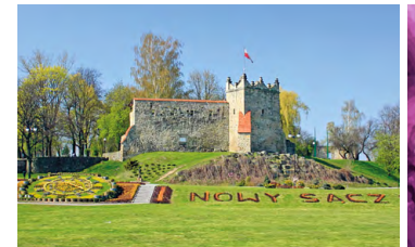
Ruiny zamku w Nowym Sączu

B Nowy Sącz, Stare Miasto – wyróżnia dobrze zachowany średniowieczny układ urbanistyczny z dużym rynkiem, na którym wznosi się eklektyczna bryła ratusza. Nieopodal znajduje się gotyck-