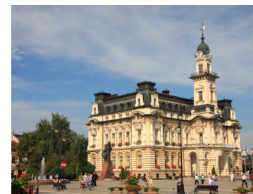
Ratusz w Nowym Sączu

położona jest w miejscowości Zbyszyce, na urokliwym cyplu i wzgórzu otoczonym z trzech stron wodami Jeziora Rożnowskiego. Winnica powstała w 2014 roku. Zajmuje powierzchnię ponad 7 ha, na których uprawianych jest 16 odmian. Głównie są to: Solaris, Riesling, Muscaris, Auxerrois, Hiberna na wina białe oraz Regent, Rondo, Ca-